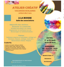
@L'art & créer