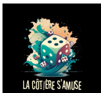
@La Côtère s'amuse