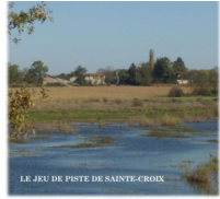
Le Plateau Est

Avec ce second jeu de piste, vous ferez un tour de 5kms sur l'un des deux plateaux encadrant le vallon, le plateau Est. Vous découvrirez un autre aspect de la commune, ainsi que son histoire plus ancienne. Disponible sur le site internet de l'Association. www.commune-sereine.fr/