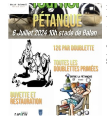
@Balan Dagneux tennis club

Le tennis club de Balan - Dagneux organise son tournoi de pétanque le 6 juillet www.facebook.com/tennisclub.debalan