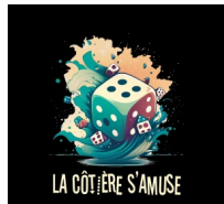
@La Côtère s'amuse