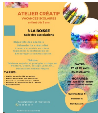
@L'art & créer