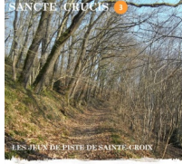
BALADE NUMÉRIQUE DANS LE BOIS DE BOTTE

Comm'Une Sereine vient de sortir un nouveau jeu de piste sur Sainte-Croix. Il propose une "balade numérique" en dix questions sur 2,3 km dans la chênaie de Botte, sur les chemins communaux. Disponible sur le site internet de l'Association. www.commune-sereine.fr/